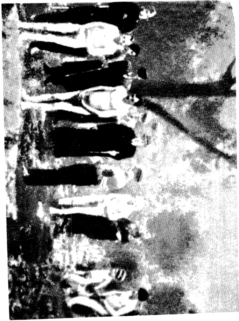
די ליטווישע באנדירטן פירן די יידן צום קבר 'אנומטן שטיט א געלט אין זיין זעלן קאפאטע מיטן ענווער אין האנט. איינשיצק, ליטע, אויגוסט 1910.